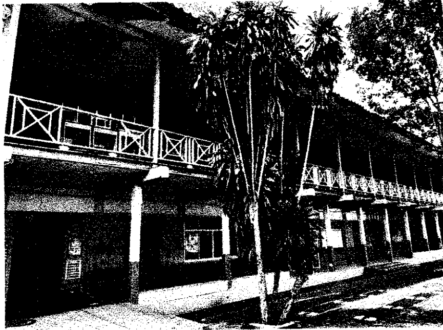
ภาพถ่ายด้านหลัง